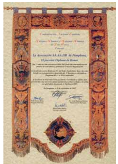
Diploma de Honor concedido por la Confederación Nacional Española a la Asociación de AA.AA.DB. de Pamplona.