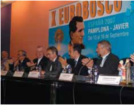
Miguel Sanz, presidente del Gobierno de Navarra, clausurando el X Eurobosco en el día de su cumpleaños.

asistentes de diez países y media docena de Inspectorías nacionales, con sus respectivas lenguas, no encontraron tedioso el desarrollo de explicaciones y el oportuno seguimiento, que tampoco era fácil. El servicio de traducción y salesianos muy puestos en el dominio idiomático, lo hicieron posible. La serie de naciones en los que están implantados los antiguos alumnos salesianos figuraba en la enseña de la Confederazione Mondiale de Ex-Allievi de Don Bosco, traída desde Italia por su Presidente, así como otra donde estaban bordadas todas las sedes en las que se habían celebrado los anteriores Eurobosco. Para contagiarse de tanta ilustración se acompañó la bandera de nuestra Asociación que hace unos años fue remozada y en la que sigue destacando el año de su confección: 1940