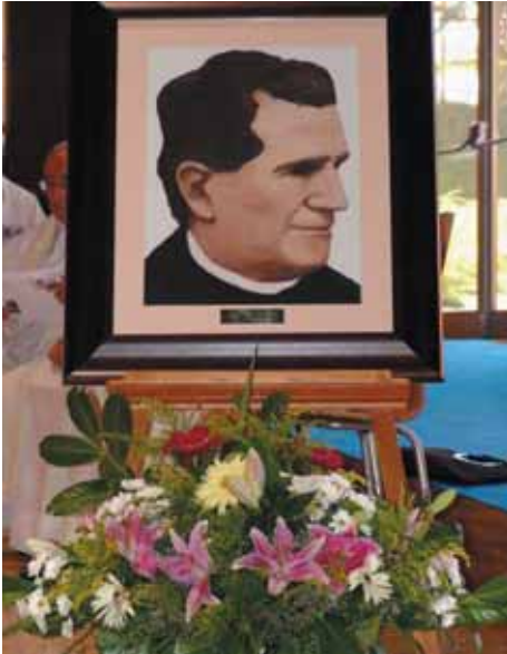
Cuadro con el que se obsequió al Rector Mayor con motivo del X Eurobosco celebrado en Pamplona obra del pintor Diego De Pablos Lizaur.