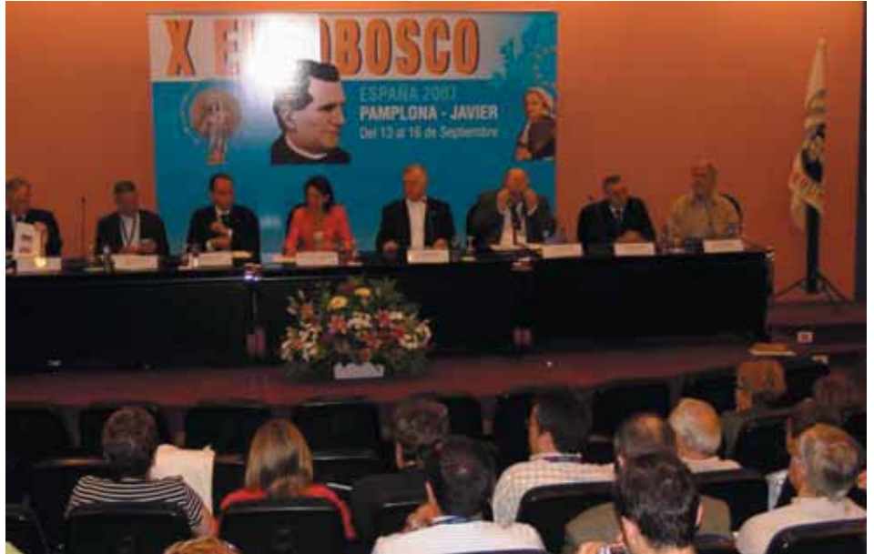
Yolanda Barcina, alcaldesa de Pamplona, inaugurando el Congreso de Ex alumnos y alumnas de colegios salesianos dando la bienvenida a la ciudad y reconociendo el afecto que la ciudad tiene con los salesianos y sus antiguos alumnos que tantos profesionales, empresarios, educadores han dado a la comunidad foral de Navarra.

El punto central de un Congreso son las ponencias y sus conclusiones. En el caso que nos ocupa, dando por sentado lo anterior, interesa recalcar que además, lo importante radicaba en que el Eurobosco lo celebraba una Organización nucleada a nivel local, regional, nacional y mundial. No era un grupo cualquiera el que se reunía y trabajaba para mejorar; eran una serie de componentes salesianos comprometidos con sus ideales y que se daban un baño de categoría por ser capaces de llevar adelante un complejo entramado de gestiones, estudios y resúmenes, poco frecuentes en colectivos de nuestras características, por otra parte no tan cuantiosos en los niveles en que nos movemos. Como para no desdeñar singularidades que cuestan esfuerzos pero dan satisfacciones por capacidad y por estilo. Pendiente de la forma final y de la publicación oficial, los acuerdos tienden a la invitación, reflexión, acción, para incrementar nuestra presencia en los medios, acrecentar la participación joven, aportar más colaboración cada uno, extender al Este la red salesiana y saber aprovechar la "Escuela de Líderes" puesta en curso por los JEX. No figurarán discusiones sobre si somos ex-alumnos o antiguos alumnos pero sí se desliza una petición para que los Salesianos hagan todavía más por su Movimiento post-escolar, habiendo ya vuelcos como las que se percibieron en el X Eurobosco, con gran representación de la cúpula turinesa y altísima proporción de salesianos de las diversas Inspecciones. El que to-