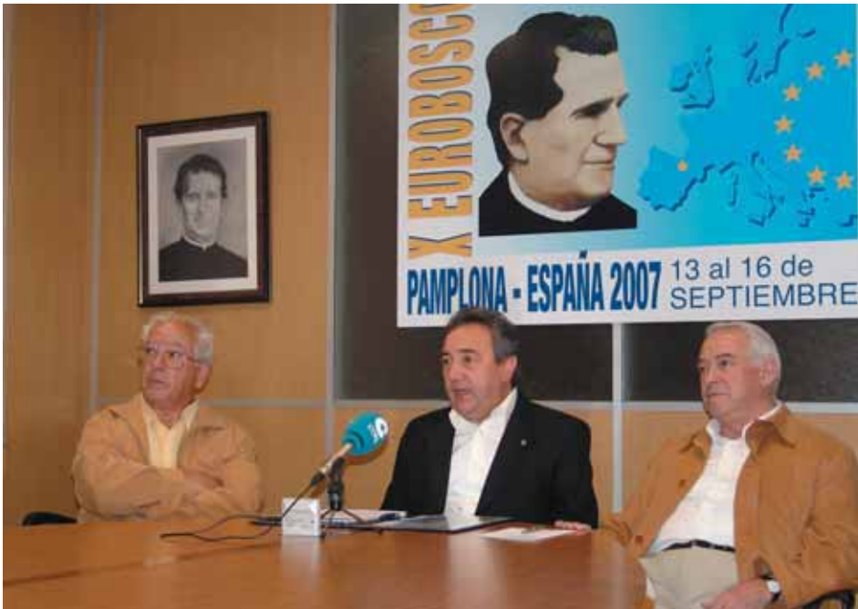
La Asociación de Antiguos y Antiguos Alumnos (AA.AA) de Salesianos Pamplona presentó a la prensa, el miércoles 12, el "X Eurobosco".

mando temas y concretando entre otras cosas la presencia del Presidente del Gobierno de Navarra en el día de la clausura del X Eurobosco.